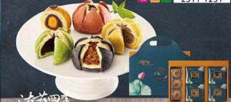
法藍四季 Frank's Season 花好月圓綜合禮盒(7入) 規格：紅豆麻糬50g*3、麻糬50g*3、麻糬50g*3、麻糬50g*3、麻糬50g*3、麻糬50g*3、麻糬50g*3 保存期限：常溫30天(請依包裝)

荷花造型餅：酥香清潤，裡之形美對人，食之酥軟香滑，別有風味，酥皮層層疊疊像含苞欲放的荷花一樣；鮑魚鮮蝦三味特產紅家麥紅山酥五穀香棗與紅玉紅家、紅豆香酥餅；手工製作層層酥餅的金黃外皮，飽入新鮮自製豆沙餡和紫薯糖霜膏，每一口散發出濃郁完美的幸福滋味。