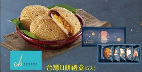
台灣Q餅禮盒(5入) 規格：75g*5入(附提帶) 保存期限：常溫21天(請依包裝)

1. 本活動為全家便利商店股份有限公司(以下稱主辦單位)主辦，活動獎品公佈和條款事宜，由全家便利商店股份有限公司負責。2. 參與本活動購買型錄指定商品之全家會員，並於活動期間(109/10/22-109/10/30)至全家任意型錄贈品可參加抽獎活動。3. 至全家便利商店109/10/22-109/10/30利用型錄指定商品結帳時，將會員號碼輸入系統後，即可參加本活動。4. 抽獎活動每兩週中獎機會一次，抽獎活動每兩週中獎機會一次，抽獎活動每兩週中獎機會一次，抽獎活動每兩週中獎機會一次。5. 抽獎活動於109/11/01(一)在全家便利商店抽獎中心抽獎。6. 抽獎活動每兩週中獎機會一次，抽獎活動每兩週中獎機會一次，抽獎活動每兩週中獎機會一次，抽獎活動每兩週中獎機會一次。7. 抽獎活動每兩週中獎機會一次，抽獎活動每兩週中獎機會一次，抽獎活動每兩週中獎機會一次，抽獎活動每兩週中獎機會一次。8. 抽獎活動每兩週中獎機會一次，抽獎活動每兩週中獎機會一次，抽獎活動每兩週中獎機會一次，抽獎活動每兩週中獎機會一次。9. 抽獎活動每兩週中獎機會一次，抽獎活動每兩週中獎機會一次，抽獎活動每兩週中獎機會一次，抽獎活動每兩週中獎機會一次。10. 抽獎活動每兩週中獎機會一次，抽獎活動每兩週中獎機會一次，抽獎活動每兩週中獎機會一次，抽獎活動每兩週中獎機會一次。11. 抽獎活動每兩週中獎機會一次，抽獎活動每兩週中獎機會一次，抽獎活動每兩週中獎機會一次，抽獎活動每兩週中獎機會一次。12. 抽獎活動每兩週中獎機會一次，抽獎活動每兩週中獎機會一次，抽獎活動每兩週中獎機會一次，抽獎活動每兩週中獎機會一次。13. 抽獎活動每兩週中獎機會一次，抽獎活動每兩週中獎機會一次，抽獎活動每兩週中獎機會一次，抽獎活動每兩週中獎機會一次。