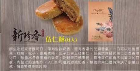
新珍香 伍仁酥(6入) 規格：85g*4.5g*6(附提帶) 保存期限：常溫30天(請依包裝)

酥皮吃起來酥酥可口，帶有些許奶香，還有香濃的芝麻香氣，一口可以吃到綠豆、核桃、松子、夏威夷果、瓜子仁等五種果仁，經過油潤的酥皮包裹著香酥可口，散發出各自獨有的香氣，吃起來口感爽脆，每種果仁都有不同層次之口感，內餡以奶油製作，入口即可嚐到濃潤的香，酥餅的果仁還特別添了酥軟的口感，頓時覺得爽脆酥軟！