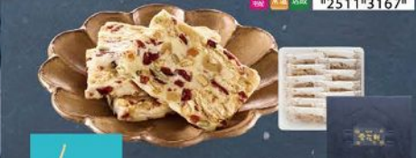
經典雪花餅(12入) 規格：22g*12入(提帶) 保存期限：常溫60天

旅行於明的小點心，到了現在依然廣受歡迎，雪白的純淨融合餅乾的酥軟Q彈，餅乾與果乾構成雪花意象，有著「粉黛雲母肌、參和雪花句」的百年美譽。