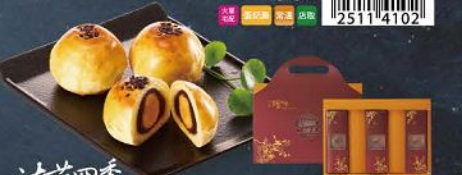
法藍四季 Frank's Season 經典蛋黃酥禮盒(9入) 規格：50g*9入(提帶) 保存期限：常溫30天(請依包裝指定取貨日期) 至少須有效日5天以上

純手工製作，層層酥軟的金黃外皮，飽入新鮮自製豆沙餡和紫薯糖霜膏，每一口散發出濃郁完美的幸福滋味。