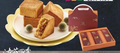
法藍四季 Frank's Season 秋月金鑽鳳梨酥禮盒(9入) 規格：50g*9入(提帶) 保存期限：常溫30天(請依包裝指定取貨日期) 至少須有效日5天以上

100%嚴選台灣以古法熬製的鳳梨甜加入少許鹹蛋黃提味，多層次口感與酥甜滋味，外皮以純西餅油與熟粉、師傅手揉而成的金黃外皮。