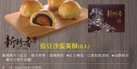
新珍香 烏豆沙蛋黃酥(8入) 規格：60g*4.5g*8(附提帶) 保存期限：常溫35天(請依包裝)，以消費滿指定取貨日期，每份有效日至少7天以上

選購內小紅豆、慢火熬煮、綿嫩綿密★紅土鴨蛋，口感軟糯滑★油酥餅皮，層次分明不油膩！