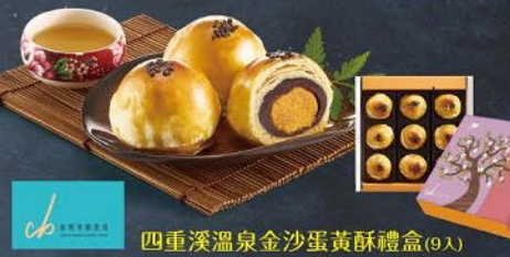
四重溪溫泉金沙蛋黃酥禮盒(9入) 規格：55g*9入(提帶) 保存期限：常溫30天(請依包裝指定取貨日期) 至少須有效日5天以上

酥皮吃起來酥酥可口，帶有些許奶香，還有香濃的芝麻香氣，一口可以吃到綠豆、核桃、松子、夏威夷果、瓜子仁等五種果仁，經過油潤的酥皮包裹著香酥可口，散發出各自獨有的香氣，吃起來口感爽脆，每種果仁都有不同層次之口感，內餡以奶油製作，入口即可嚐到濃潤的香，酥餅的果仁還特別添了酥軟的口感，頓時覺得爽脆酥軟！