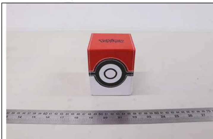
照片 A：測試樣品外觀 -正面