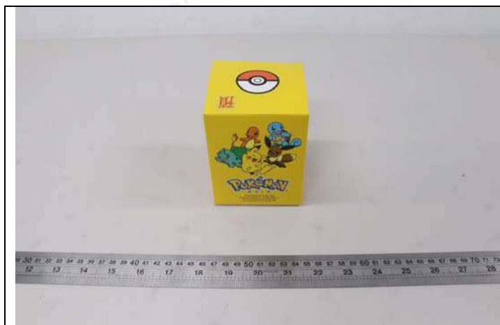
照片 C：樣品包裝 -正面