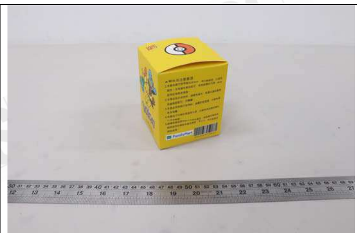
照片 D：樣品包裝 -側面